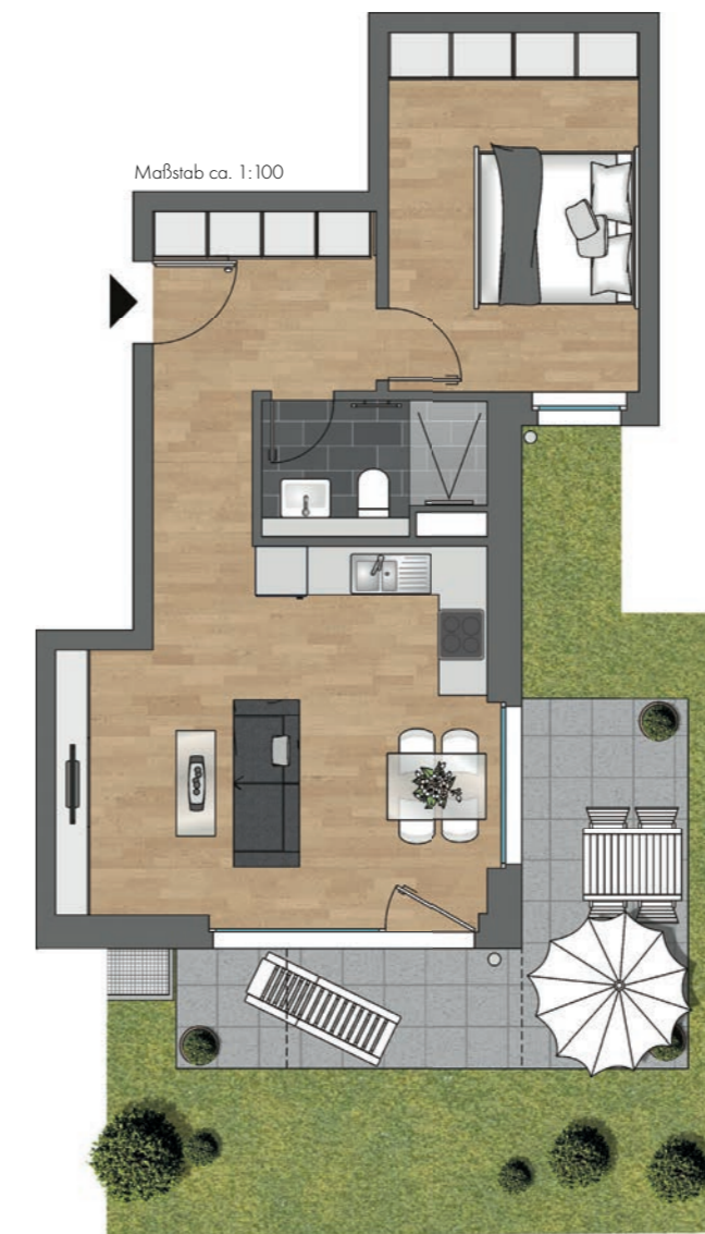
Maßstab ca. 1:100

unverb. Illustration, Änderungen vorbehalten