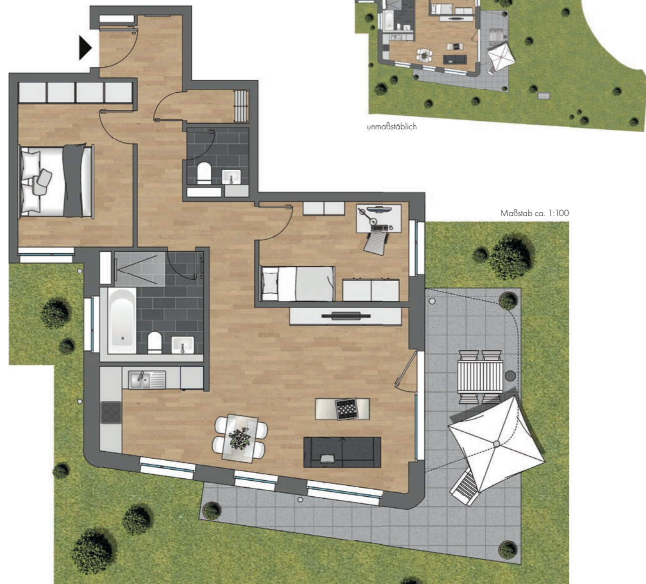
Maßstab ca. 1:100

Garten aus Darstellungsgründen gekürzt unverb. Illustration, Änderungen vorbehalten